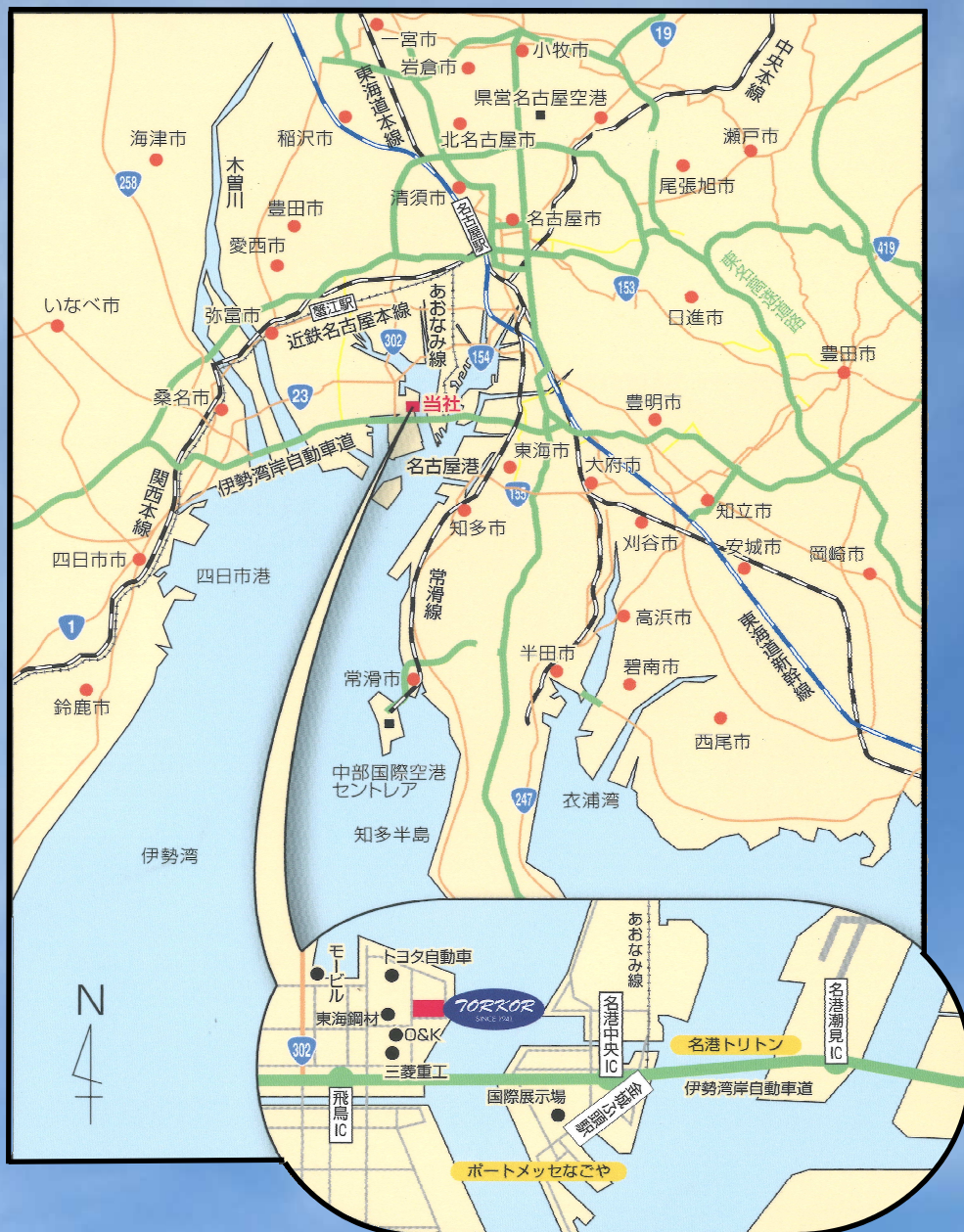
名古屋港西部臨海工業団地（西部2区鉄鋼団地内）